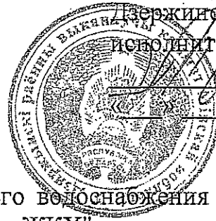
График планового отключения горячего водоснабжения в жилых домах г. Фаниполь и д. Вязань УП "Дзержинское ЖКХ" в межотопительный период 2020 года.