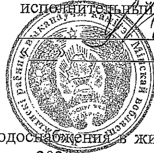
График планового отключения горячего водоснабжения в жилых домах УП «Дзержинское ЖКХ» в межотопительный период 2020 года.